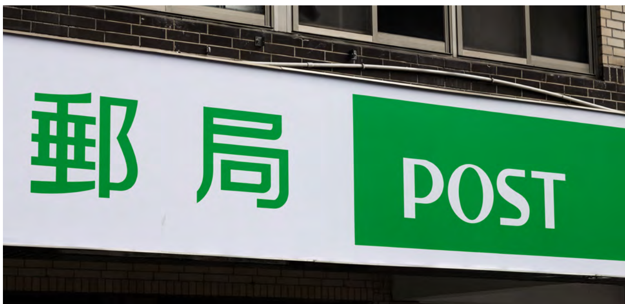
郵局 中華郵政 ▲

郵政儲金是交通部轄下的國營事業。中華郵政公司最初成立的目的是提供郵政服務，後來業務範圍擴大到儲蓄、匯款和壽險等領域。 38 金管會對郵政儲金的金融業務具有監管權，因此，郵政儲金必須遵守金管會的「綠色金融行動方案」。為配合該政策，中華郵政發布了 2022 年、2023 年和 2024 年的氣候相關財務揭露報告。 39/40/41