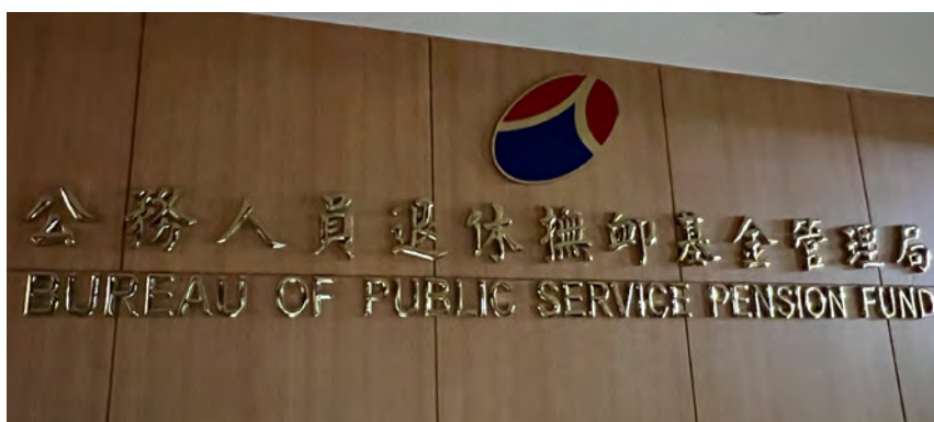
公務人員退休撫卹基金管理局 ▲

退撫基金管理局管理著規模約 1 兆新台幣的退撫基金，並由同屬考試院轄下的「公務人員退休撫卹基金監理委員會」（下稱退撫基金監理會）負責審查、監督和評估退撫基金的投資運用及績效。退撫基金管理局